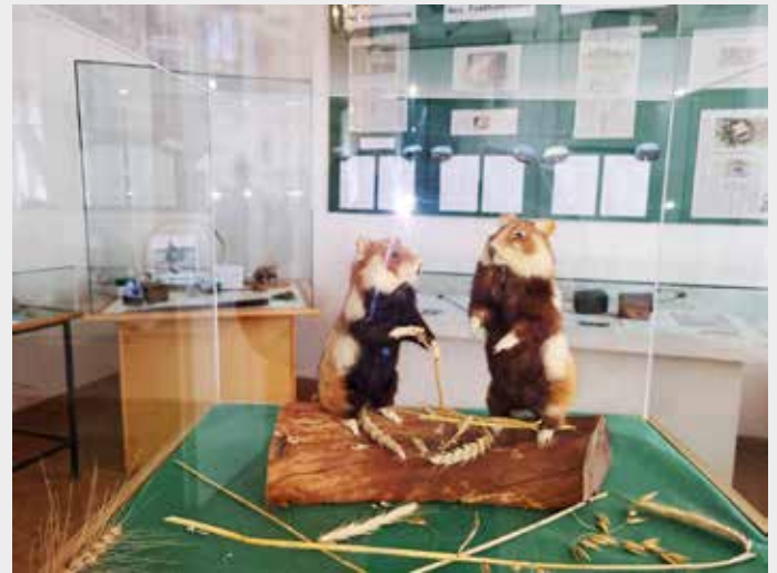
Jetzt im Stadtmuseum „Wilhelm von Kugelgen“- auf Anfrage auch mit Führung!

Landwirte fürchteten den Feldhamster als ein überaus gefräßiges, boshaftes und bissiges Tier, das ihnen die Ernte schmälerte und deshalb intensiv bekämpft wurde. Historische Berichte aus der Presse aus den ersten Jahrzehnten des 20. Jahrhunderts gewähren einen kleinen Einblick in die Geschehnisse der damaligen Zeit.