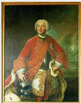
Gemälde: Viktor Friedrich v. Anhalt Bernburg :: Museum Schloss Bernburg :: museum-digital:sachsen-anhalt

Aufenthalts- und Regierungssitz, wodurch Verwaltung, Hof und Infrastruktur wuchsen. Damit legte Viktor Friedrich entscheidende Grundlagen für die spätere Entwicklung zur Residenzstadt. Insgesamt erscheint er als typischer Reformherrscher der Aufklärungszeit: geprägt von Bildung und europäischer Erfahrung, reformorientiert in Wirtschaft und Verwaltung, zugleich fest in der frühneuzeitlichen Fürstenherrschaft verankert. Seine Politik wirkte weit über seine Regierungszeit hinaus und formte die Entwicklung Ballenstedts nachhaltig.