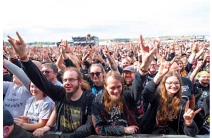
ROCKHARZ 2024 | Impressionen