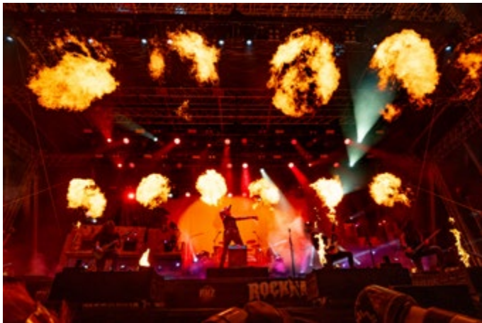
HEAVENSHALLBURN | ROCKHARZ2025

CA, MITTEL ALTA, MOTORJESUS, NECROTTED, PARADISE LOST, P.O.D., RAUHBEIN, RODEO 5000, SAGENBRINGER, SOEN, SOULBOUND, STAHL-MANN, STEVE N SEAGULLS, SUBWAY TO SALLY, TAILGUNNER, THE HAUNTED, TUNGSTEN, WALLS OF JERICHO, WARMEN, WATCH ME RISE